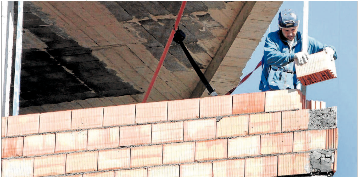
El sector de la construcción está mejorando levemente sus indicadores en este 2015. LA OPINIÓN